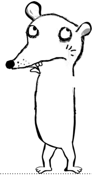
Maus Maroni Illustration: Nadia Budde