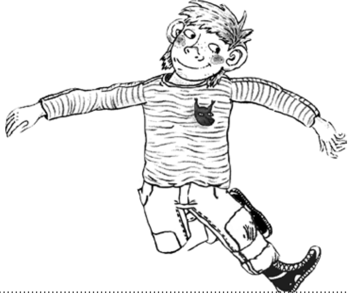
Linus Illustration: Lika Nüssli