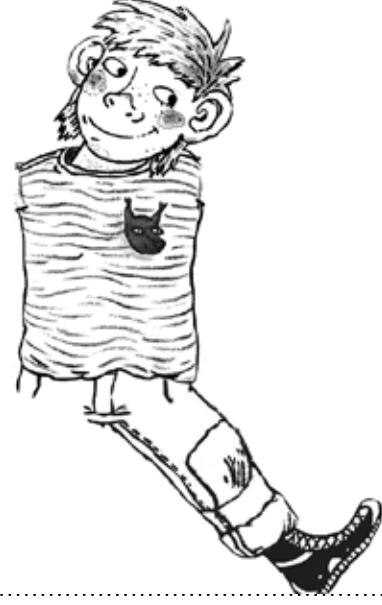
Linus Illustration: Lika Nüssli

Ausmalen und fehlende Arme, Beine und einen Hintergrund zeichnen. Die Arm- und Beinbewegung soll anders sein, als auf dem ersten Bild.